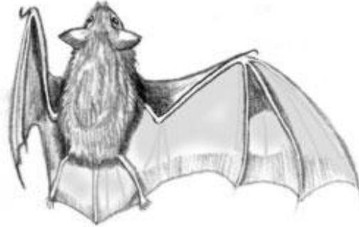
Chauve souris (vleermuis)

Het bezoek aan de grot duurt ongeveer 1 uur en 20 minuten. In de grot is een wandeltraject (heen) en een boottochtje (terug). Men zegt dat dit de grot met de langste ondergrondse boottocht is. In de grot leven ook bijzondere diertjes, zoals vleermuizen en doorzichtige garnalen (omdat ze niet in het licht komen hebben deze geen pigment in hun lichaam (kleurstof)).